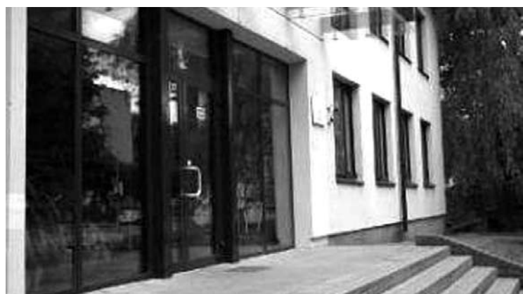
Prie Anykščių muzikos mokyklos siekiama prijungti Anykščių kūrybos ir dailės mokyklą.