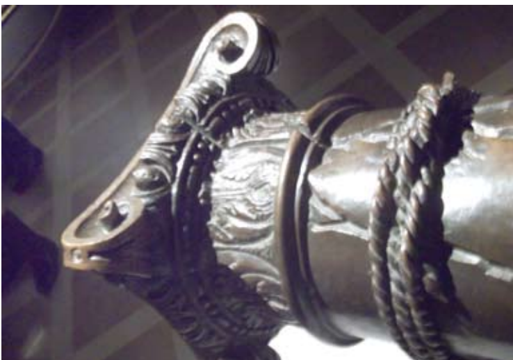
Tai ne barokinė kolona, o Radvilų patrankos vamzdis. Iki pramoninių laikų patrankos dažnai buvo kuriamos kaip meno kūriniai, joms kartais net suteikdavo vardus.

Tuo pačiu šventas sostinės vietas lankiau, didmiesčio dvasia gaivinausi ir kaip dovaną didžiulę parodą, skirtą didikų Radvilų giminei, Valdovų rūmuose lankiau.