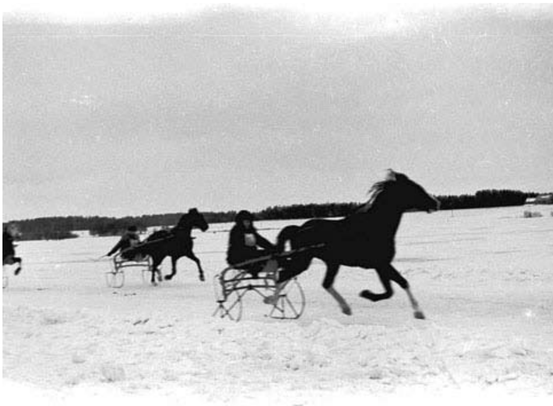
Žirgų lenktynės Svėdasuose, ant Alaušo ežero ledo. Paskutinis sausio sekmadienis apie 1970 – ius.