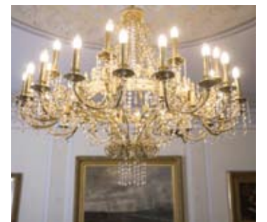
Rūmų prabangos detalė - puošnus sietynas...

Dvaras restauruotas pagal XIX amžiaus projektą ir apstatytas to laikmečio baldais. Teigiama, kad ypač vertingi XIX-ajį amžių menantys rūmų židiniai. Dvare įrengti aukšto lygio viešbučio kambariai, juose, be abejo, šiuolaikinė santechnika ir kita įranga, tačiau interjeras bei baldai XIX-ojo amžiaus stiliaus. Dvaro viešbučio lovos taip pat, regis,