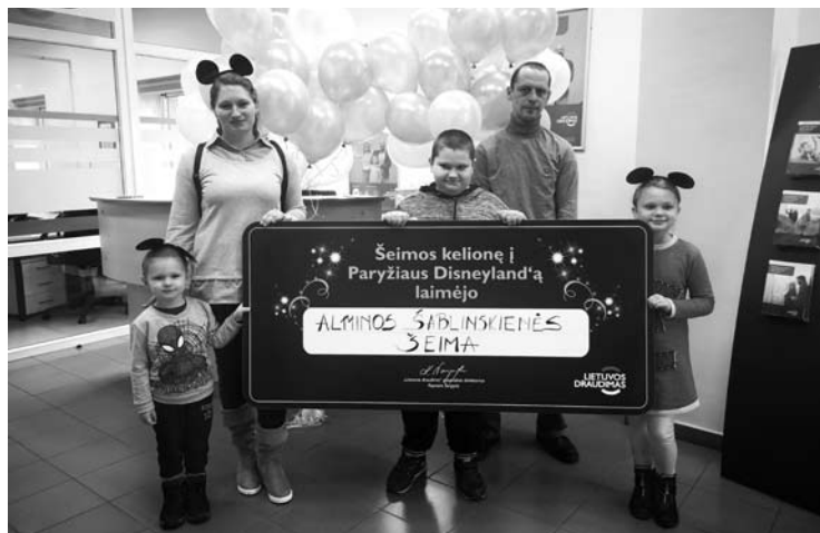
Pamatyti Disneilendą laimė nusišypsojo penkių asmenų šeimynai.