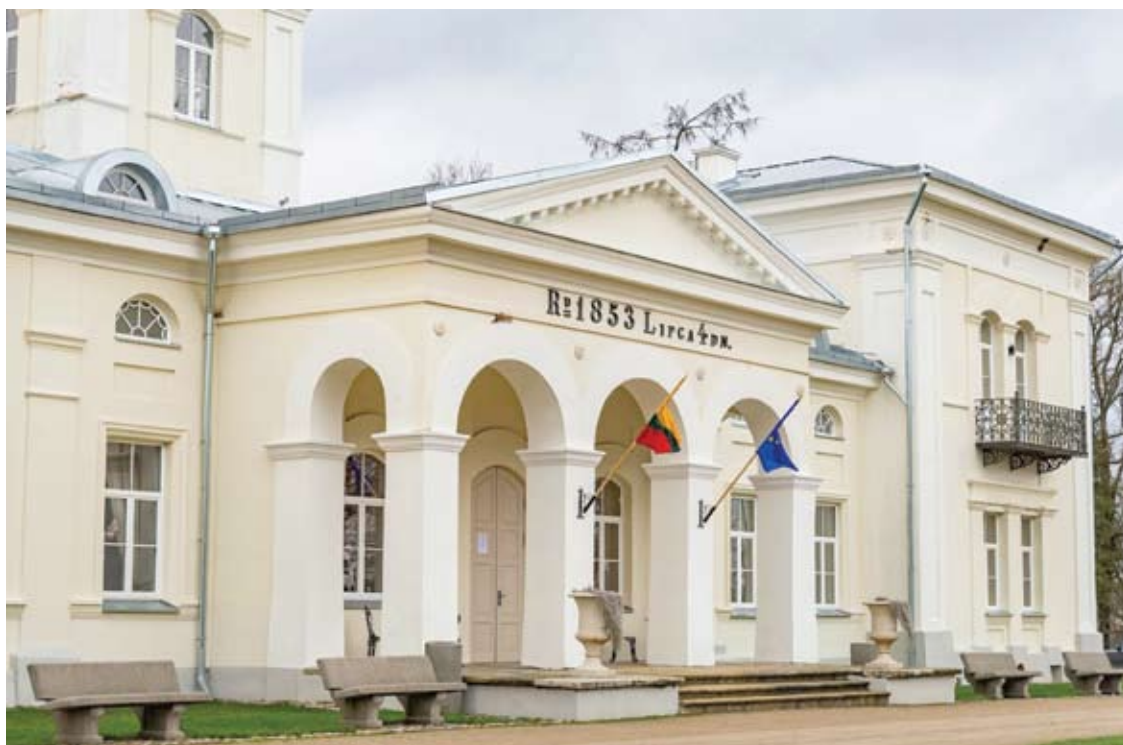
Burbiškio dvare gyveno šešios grafų Venclovavičių kartos. Šios giminės istoriją yra aprašęs rašytojas Antanas Vienuolis - Žukauskas apysakoje „Vėžys“.