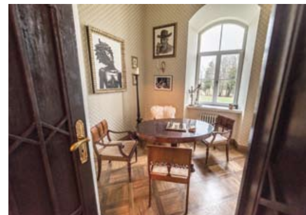
Burbiškio dvaras restauruotas pagal XIX amžiaus projektą ir apstatytas to laikotarpio baldais.